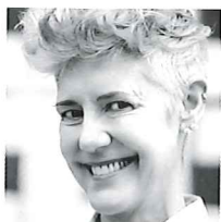
アストリッド・クライン (建築家) Astrid Klein

クライン ダイサム アーキテクト代表。 イタリア生まれ。ロンドン・RCA を卒業後、マーク・ダイサムと共に 現事務所を設立。デザインや建築 に関する国際会議にも多数出席。